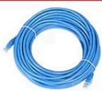
câble réseau gigabit (15m)