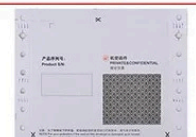
Enveloppe universelle de mot de passe