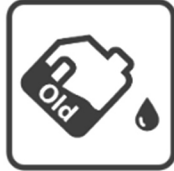
Vidange réservoir d'huile usagée