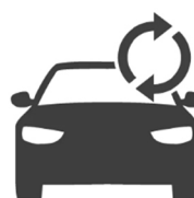
Véhicule fréquemment utilisé