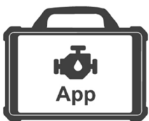
Application de commande à distance