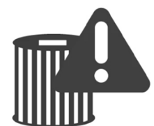
Avertissement de remplacement du filtre