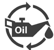
Échange automatique de haute précision