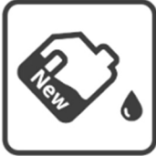
Vidange réservoir d'huile neuve