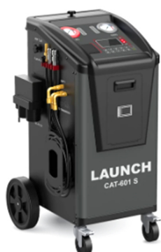
Station BVA - CAT-601S