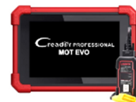
CRP MOT EVO - Diagnostic complet avec VCI Bluetooth