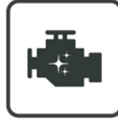
Échange classique avec nettoyant