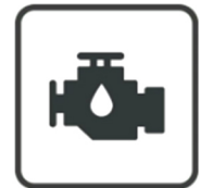
Échange avec filtre interne