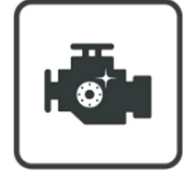
Échange avec filtre interne et nettoyant