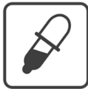
Échantillonnage d'huile usée