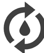
Cycle de nettoyage avec détergent